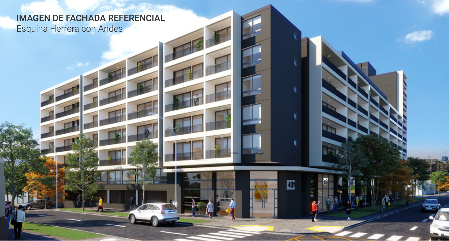
IMAGEN DE FACHADA REFERENCIAL Esquina Herrera con Andes